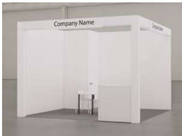
Vista frontale – stand a 2 lati aperti | immagine indicativa

Per maggiori informazioni: zoomark.setup@henoto.com