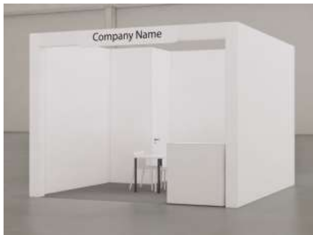
Vista frontale – stand a 1 lato aperto | immagine indicativa