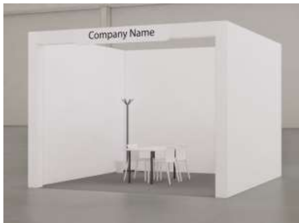
Vista frontale – stand a 1 lato aperto | immagine indicativa