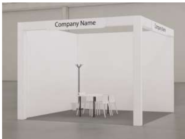
Vista frontale – stand a 2 lati aperti | immagine indicativa

Per maggiori informazioni: zoomark.setup@henoto.com