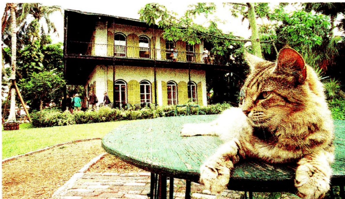
Venerati. Un ospite della casa-museo di Ernest Hemingway a Key West (Florida), che lo scrittore lasciò in eredità ai suoi 56 felini

* Canale Grocery + Specializzato (Tradizionali + Catene + Petshop GDO) - Fonte: Euromonitor; Circa